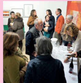
Une dégustation avec un vigneron et une vigneronne de Chinon

Suivi d'une dégustation de vins de Chinon et de fouaces.