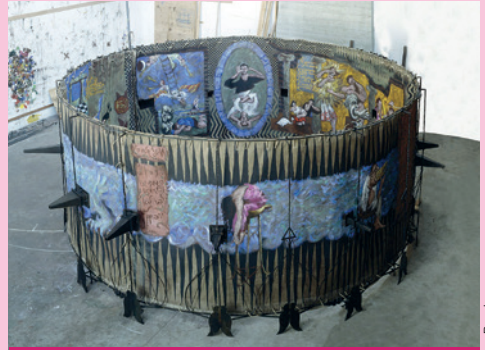
La Dive Bacbuc, 1998

Visite commentée en présence de Gérard Garouste. Exposition du 20 octobre au 5 novembre de 9h30 à 17h - En accès libre