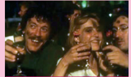
Faictz ce que voudras

Suivi d'une dégustation de vins de Chinon.